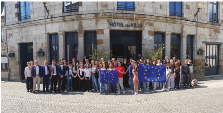
MAISON DE L'EUROPE